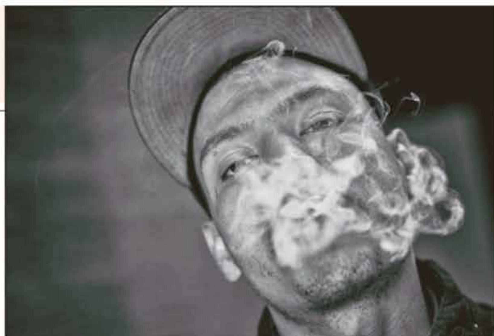
De terugblik op 2017 is een kloek foto-boek geworden.

'Geen fratsen, gewoon je dingen doen en jezelf blijven'