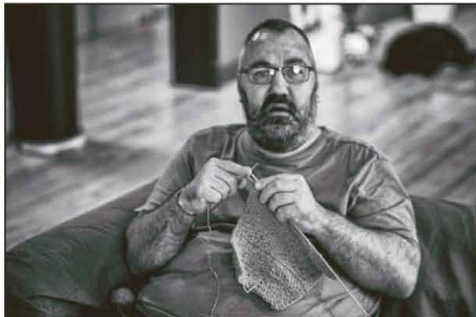
Cliënt van Oranjeborg.