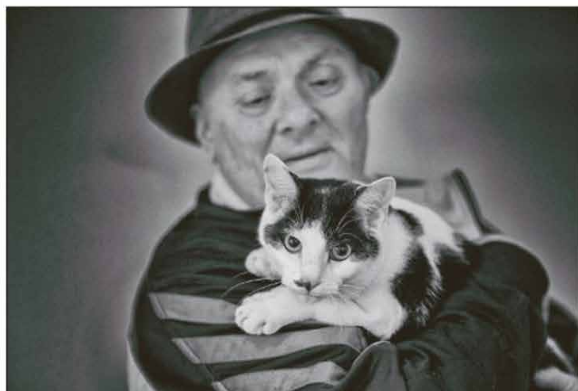
Eén van de vele honderden foto's in het jaarverslag van Oranjeborg.